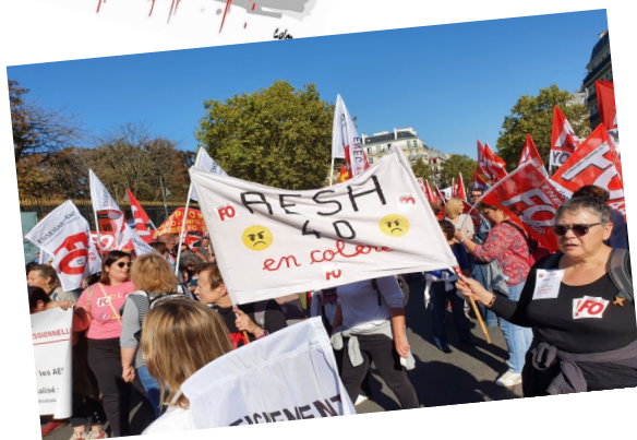
Manifestation nationale AESH – Paris, 19 Octobre 2021