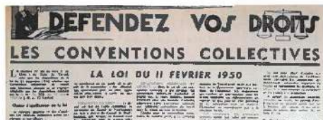
1 La loi sur les conventions collectives du 11 février 1950 a été obtenue à l'issue d'un appel à la grève lancé par FO en novembre 1949